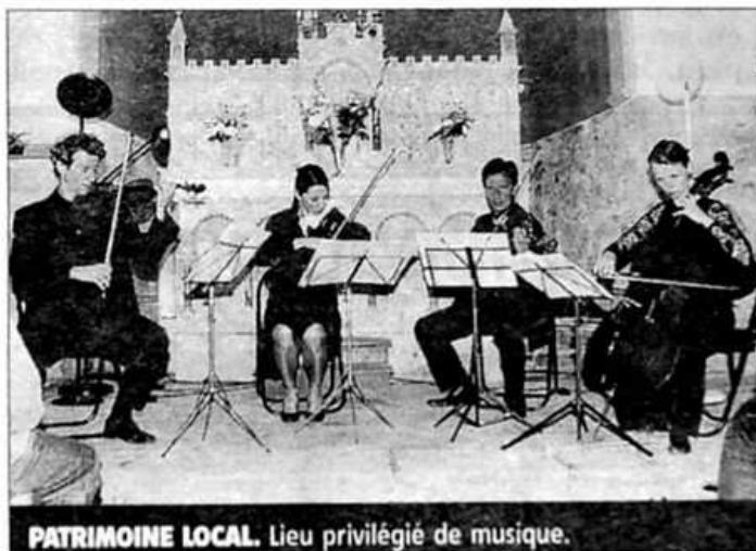
PATRIMOINE LOCAL. Lieu privilégié de musique.

« Sérénade à Saint-Santin », a reçu l'accueil qu'il méritait puisque l'église, un lieu privilégié du patrimoine local, convenait à ce récital tourné vers un nouveau public, une des